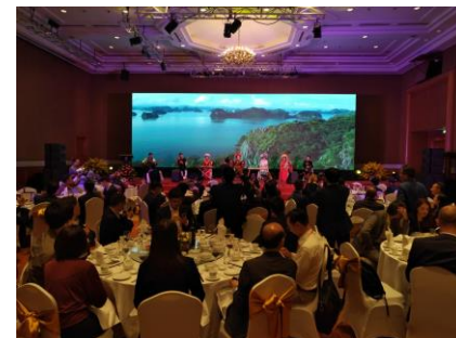
歓迎レセプションの様子