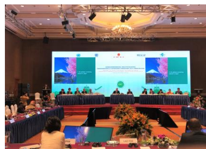
プレゼン中の筆者 (前方左端)