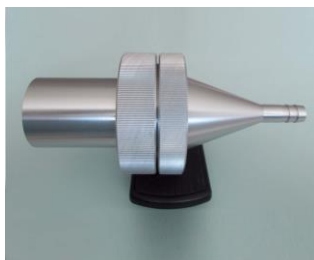
フィルタフォルダをセット